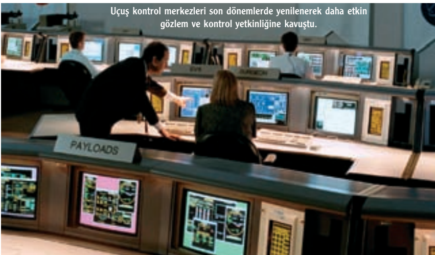
Uçuş kontrol merkezleri son dönemlerde yenilenecek daha etkin gözlem ve kontrol yetkinliğine kavuştu.

Kaynaklar: http://www.turkatak.gen.tr/index.php?option=content&task=view&id=73 http://www.jsc.nasa.gov/history/jsc40/jsc40_pg8.htm http://en.wikipedia.org/wiki/Spaceport