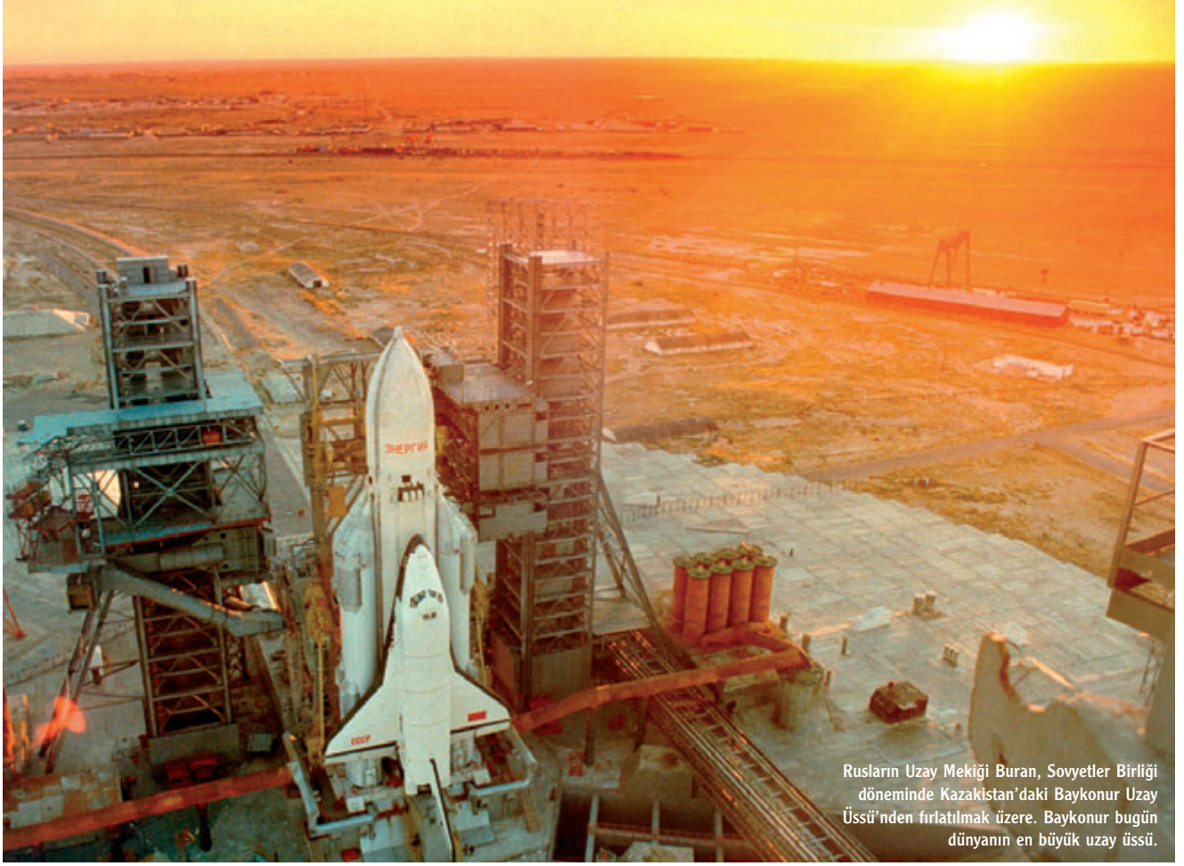
Rusların Uzay Mekiği Buran, Sovyetler Birliği döneminde Kazakistan'daki Baykonur Uzay Üssü'nden fırlatılmak üzere. Baykonur bugün dünyanın en büyük uzay üssü.

milerinde uçuş teknikleri geliştirilirken kimilerinde astronot eğitimleri yapılıyor. Kimileri uzay aracı üretiminde uzmanlaşmışken kimileriye yerden uzaya destek verme konusunda görevler üstlenmiş. Uzay üsleri arasında en ünlülerinden biri Baykonur Uzay Üssü. Kazakistan'ın Baykonur kentinin 320 km güneydoğusunda kurulmuş olan üs, dünyanın en eski ve en büyük üssü olma özelliğini taşıyor. Kentten bu kadar uzak olmasına karşın üssün Baykonur adını taşımasını nedeni Sovyet yönetiminin zamanında bir yanıtma unsuru olarak bu ismi vermiş olması. Kozmodrom olarak da bilinen Baykonur Uzay Üssü'nde bir düzineden fazla fırlatma rampasının yanı sıra beş kontrol kulesi ve dokuz farklı kontrol merkezi bulunuyor. 2 Haziran 1955'te hizmete giren üssün genişliği kuzeyden güneye 80 km, doğudan batıya 130 km. Yapımında askerlerin çalıştığı üssün tamamlanması iki buçuk yıl sürmüştü. Üs yakınlarına, çalışanların ve ailelerinin kalması amacıyla Tyuratam (Sovyet dönemindeki adı Leninsk) kenti kurulmuş. Rus insanlı uzay araçları ve uzay sondaları Baykonur Uzay Üssü'nden fırlatılmış. Uzay tarihinde yer alan birçok önemli uçuşun başlangıç noktası Baykonur olmuş. İnsan yapımı ilk uydusu olan Sputnik-1'in, 4 Ekim 1957'de ilk insanlı yö-