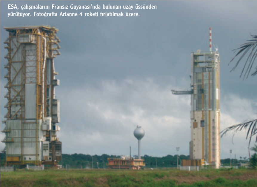
ESA, çalışmalarını Fransız Guyanası'nda bulunan uzay üssünden yürütüyor. Fotoğrafta Ariane 4 roketi fırlatılmak üzere.

Uzay mekiklerinin evi olarak bilinen Kennedy Uzay Üssü de en tanın-