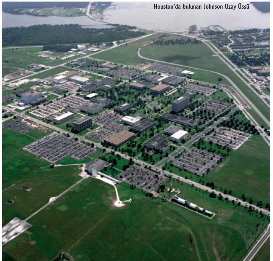
Houston'da bulunan Johnson Uzay Üssü

bir ölçüttü. Öncelikle bir kent olmalıydı; çünkü gereksinim duyacağımız teknoloji enstitülerini destekleyecek olanaklar bir kentte bulunabiliyordu. Bir havaalanı olmalıydı; böylece uçuş testlerimizi gerçekleştirebilir, uzay araçlarımızı indirebileceğimiz bir alana sahip olabilirdik. O dönemlerde uzay araçlarımızı deniz yoluyla, teknelerle taşımayı planlıyorduk; bu nedenle üs deniz