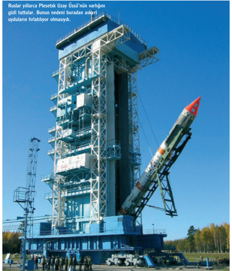
Ruslar yıllarca Plesetsk Uzay Üssü'nün varlığını gizli tuttular. Bunun nedeni buradan askeri uyduların fırlatılıyor olmasıydı.

nur üssü, Kazakistan Cumhuriyeti sınırlarında kaldı. Bununla birlikte Rusya Federasyonu yıllık 115 milyon dolar kira bedeli ödeyerek üssü 2050 yılına kadar kiralandı. Rusya Federasyonu'nun uzay görevleri bu üsten yürü-