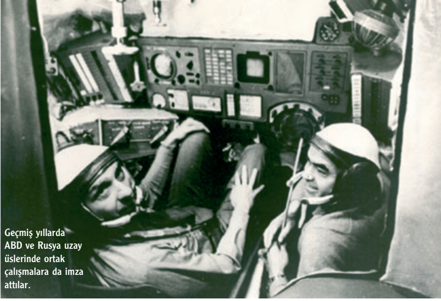
Geçmiş yıllarda ABD ve Rusya uzay üslerinde ortak çalışmalara da imza atıldılar.

tülmeye devam ediyor. Yetkililer Baykonur Uzay Üssü'nün yapımından bugüne değin, yaklaşık 1100 fırlatma yapıldığını söylüyorlar. 1980-1990 yılları arasında MIR uzay programını destekleyen üs, Columbia felaketinden sonra ABD'nin uzay mekiği programına ara vermesiyle, Uluslararası Uzay İstasyonu'na destek veren tek üs haline gelmişti. Başlangıçta Rusların balistik füzelerine ev sahipliği yapan üste bugün Soyuz uzay araçları bulunuyor. Baykonur Uzay Üssü Rusya'ya kiralanırken yapılan antlaşmada yer alan maddelerden biri, Kazakistan'ın üstün dilettiği gibi yararlanabilmesiydi. Kazakistan ve Rusya geçtiğimiz yıllarda Baykonur içinde Bayterek adı verilen yeni bir uzay kompleksi kurdular. Kazakistan'ın desteğiyle gelişen bu projenin amacı, uzay araçlarının çevreye zarar vermeden uzaya gönderilmesi. Baykonur, bugün çalışmalarını sürdüren uzay üsleri arasında en büyük olanı. Rusya, Arganjelsk'te bulunan Ple-